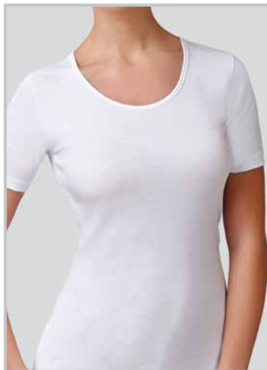
art. 9005 M/M profilo raso taglie: 3/7 colori: bianco nero