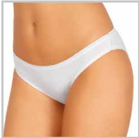
art. 01 slip vita bassa