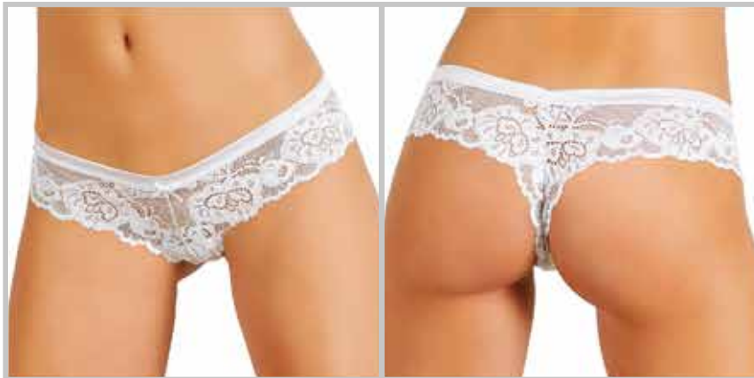
art. 1400 perizoma