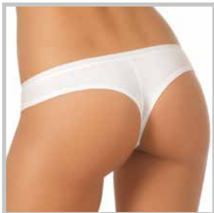
art. 2001 brasiliano taglie: 2/4