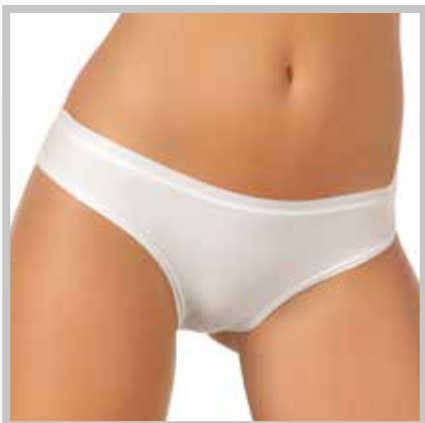
art. 2000 slip taglie: 2/5