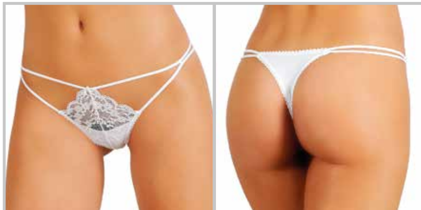
art. 1435 slip