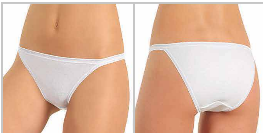
art. 7004 tanga