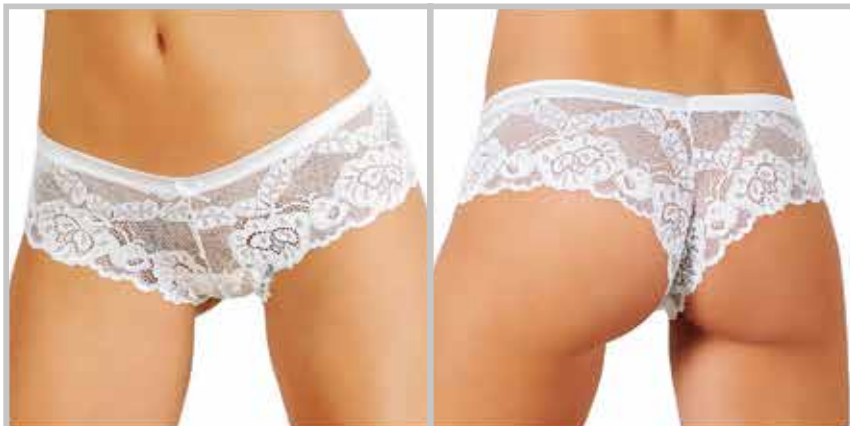
art. 1401 boxer donna