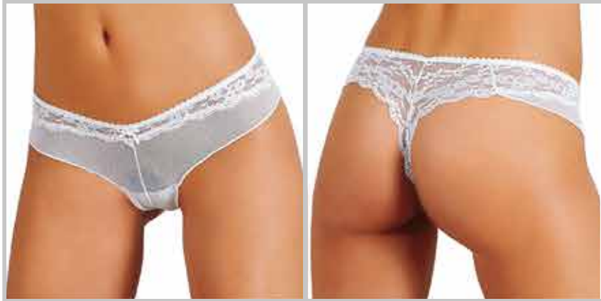
art. 1443 perizoma