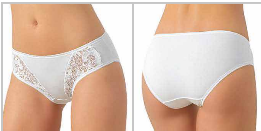
art. 7007 slip