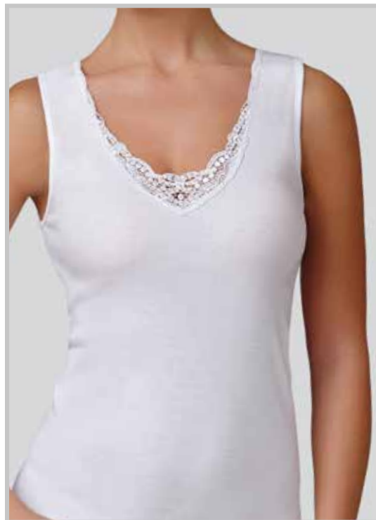
art. 9001 S/L macramè taglie: 3/7 colori: bianco nero