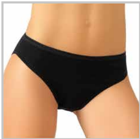
art. 02 slip