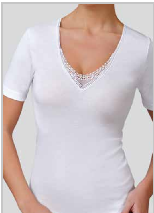
art. 9002 M/M macramè taglie: 3/7 colori: bianco nero