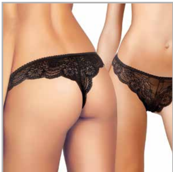
art. 1629 perizoma taglie: 2/4 colori: bianco nero