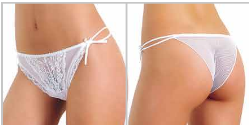
art. 1465 tanga