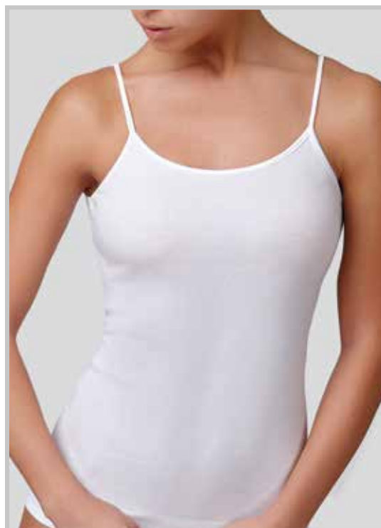
art. 9003 top profilo raso taglie: 3/7 colori: bianco nero