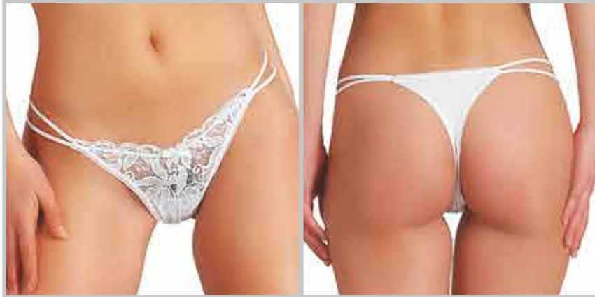
art. 1380 perizoma