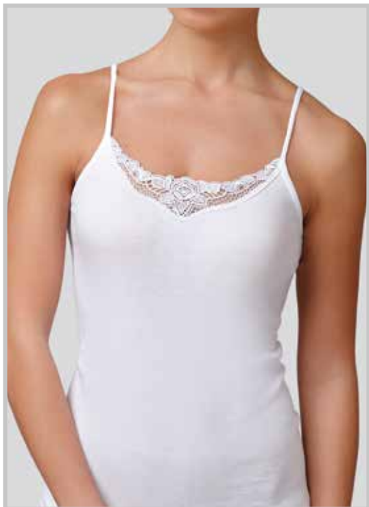
art. 9000 top macramè taglie: 3/7 colori: bianco nero