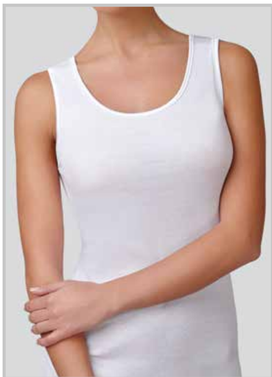
art. 9004 S/L profilo raso taglie: 3/7 colori: bianco nero