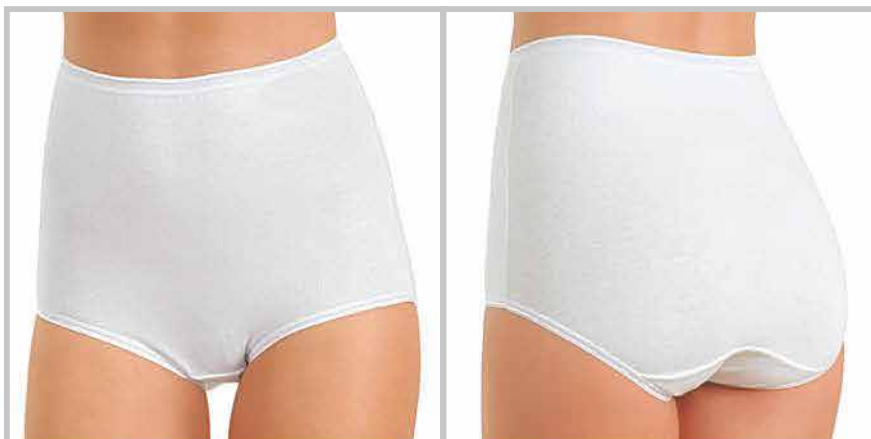
art. 7005 coulottes