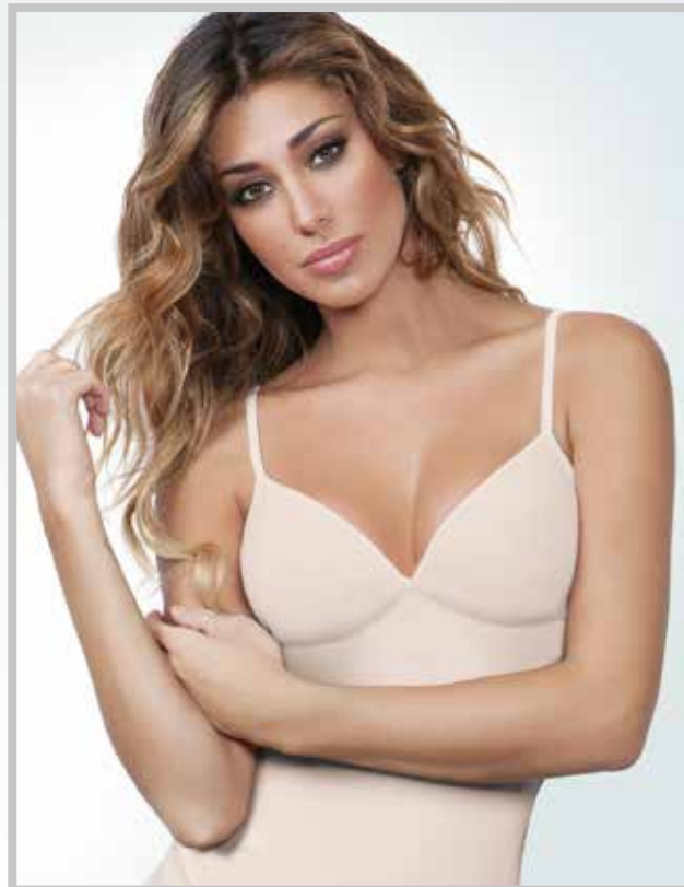
art. 2009 top taglioseno taglie: S - M - L