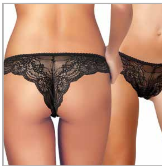
art. 1628 brasiliano taglie: 2/4 colori: bianco nero