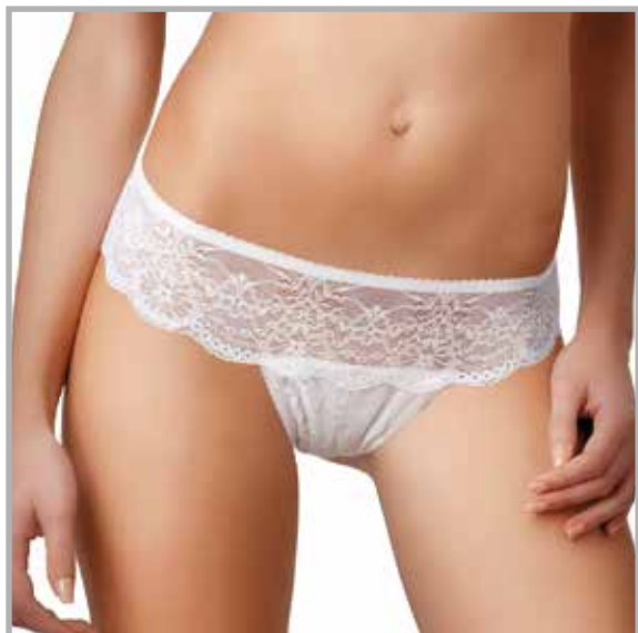
art. 1627 slip taglie: 2/5 colori: bianco nero