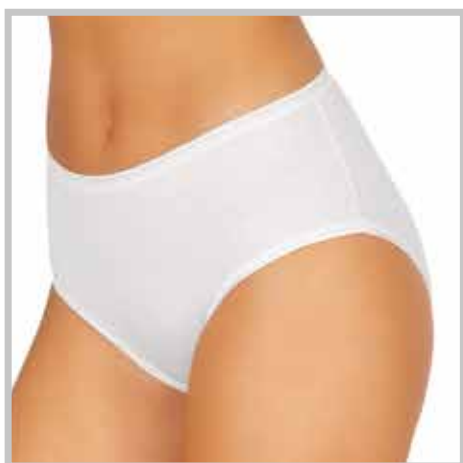
art. 03 slip midi