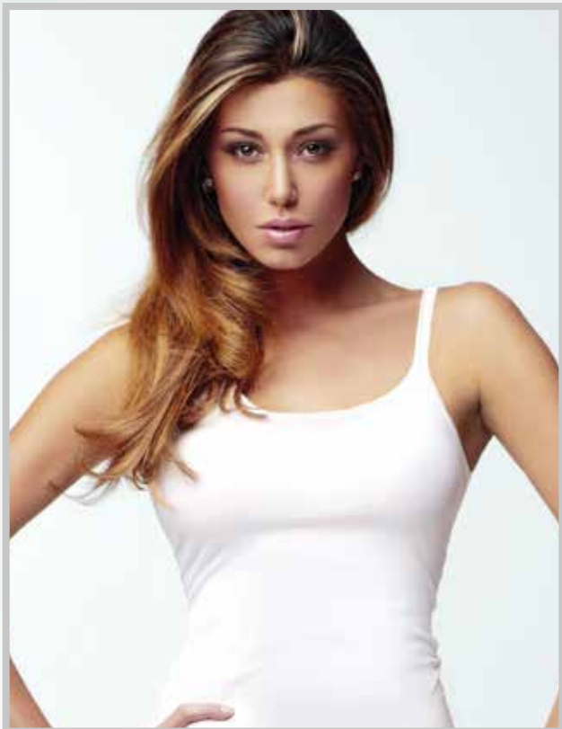
art. 2005 top taglie: S - M - L