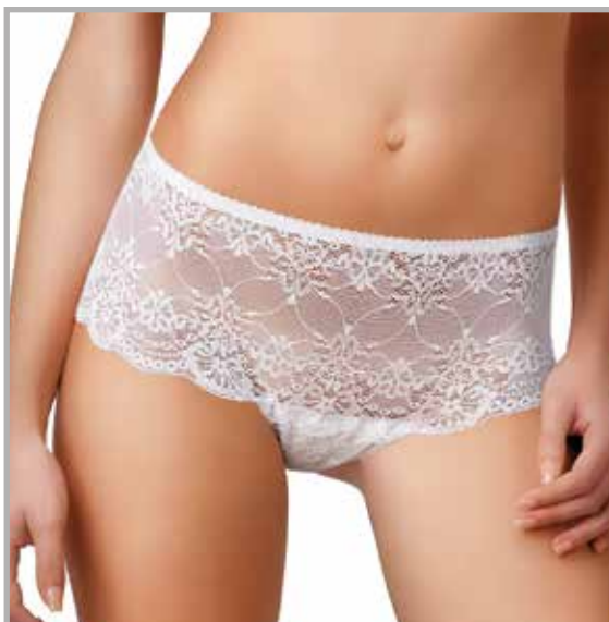
art. 1630 short taglie: 2/5 colori: bianco nero

composizione: 92% poliammide - 8% elastomero