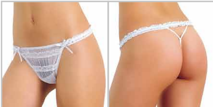
art. 1462 perizoma