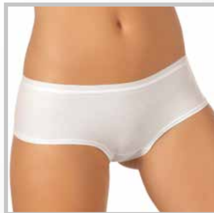
art. 2002 slip alto taglie: 2/5