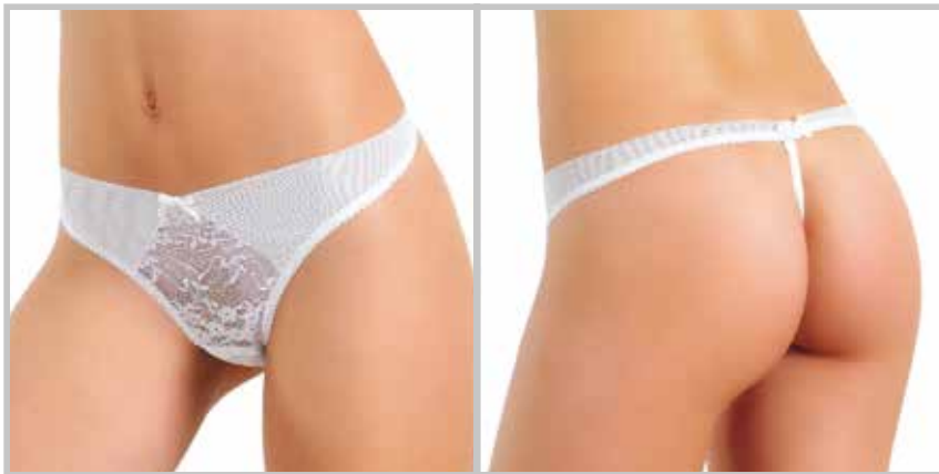
art. 1459 perizoma